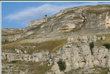
Gravina di Matera The Gravina of Matera