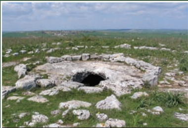
Tomba età del bronzo Bronze Age tomb