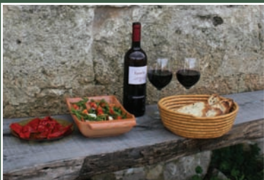
Bar e prodotti tipici Bar and typical food