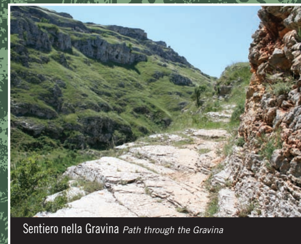
Sentiero nella Gravina Path through the Gravina