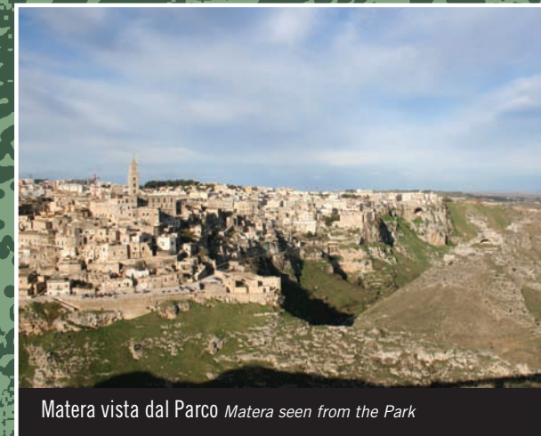
Matera vista dal Parco Matera seen from the Park

San Nicola all'Appia, Sant'Elia, San Vito alla Murgia, Sant'Agnesa.