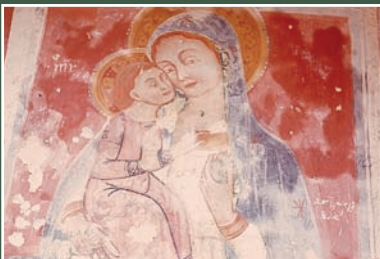
Madonna delle Tre Porte