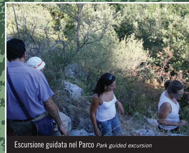
Escursione guidata nel Parco Park guided excursion