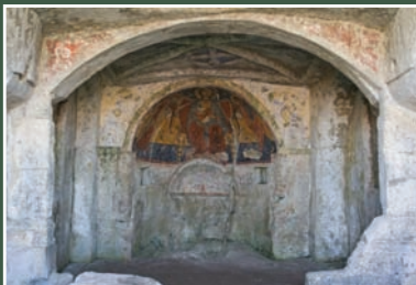
Madonna delle Croci