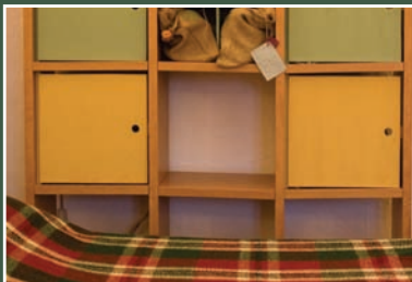
Foresteria Masseria Radogna Guestrooms